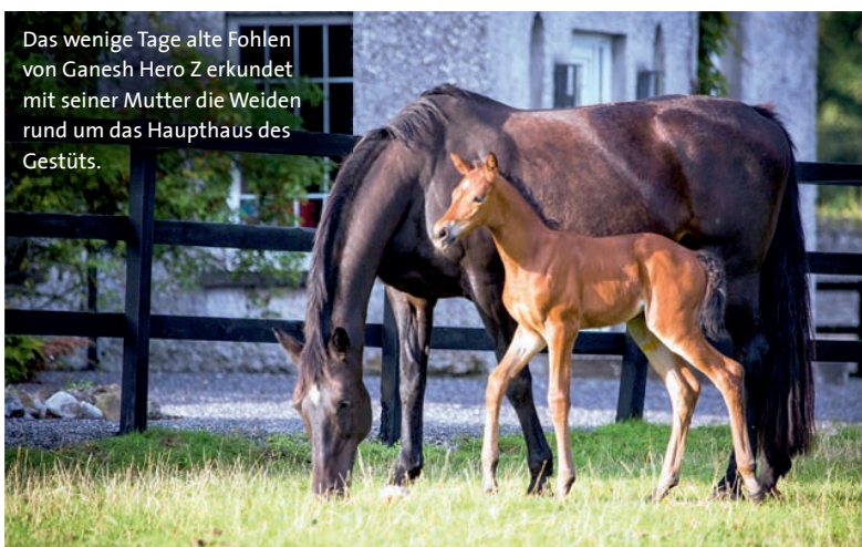
Das wenige Tage alte Fohlen von Ganesh Hero Z erkundet mit seiner Mutter die Weiden rund um das Haupthaus des Gestüts.